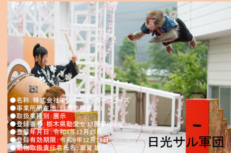
● 名称：株式会社ニッポンエンタープライズ ● 事業所所在地：日光市積善寺 ● 取扱業種別：展示 ● 登録番号：栃木県動産セ七厚第60号 ● 登録年月日：令和4年12月13日 ● 登録有効期限：令和9年12月12日 ● 動物取扱責任者氏名：瀬賀 基伸