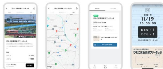
企画乗車券のイメージ 近江鉄道、信楽高原鐵道 / びわこ京阪奈線フリーきっぷ