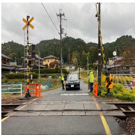
踏切事故防止キャンペーン

より安全で信頼される信楽高原鐵道をつくるため、春・秋の全国交通安全運動、踏切事故防止キャンペーンを通じ安全な鐵道作りへのご参加をお願いするとともに、皆様から安全へのご意見もお寄せ下さい。また、不審者から地域の子供の安全を守り、子供達が安心して暮らせる取り組みとして日本民営鐵道協会と連携し「こども110番の駅」を実施しています。「こども110番の駅」では目印となるステッカーを見て、子供が駅に助けを求めてきた場合に、子供を保護し、子供に代わって110番通報を行うなどの対応をとります。合わせて、踏切・橋梁等の異常を発見されたときは、現地に表記しております「信楽高原鐵道への連絡先」へ御連絡頂きますようお願いいたします。