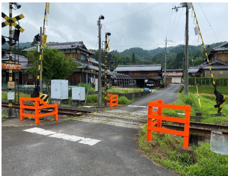
新久保出踏切の保安度向上

また、踏切周辺設備の保安度向上を図るとともに、踏切通行時の視認性を向上することにより、安全確保に努めているところです。