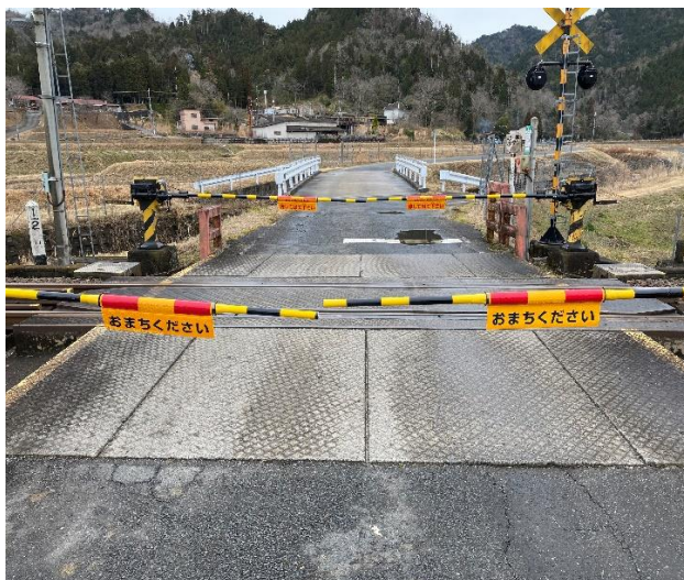
岩倉踏切の視認性向上