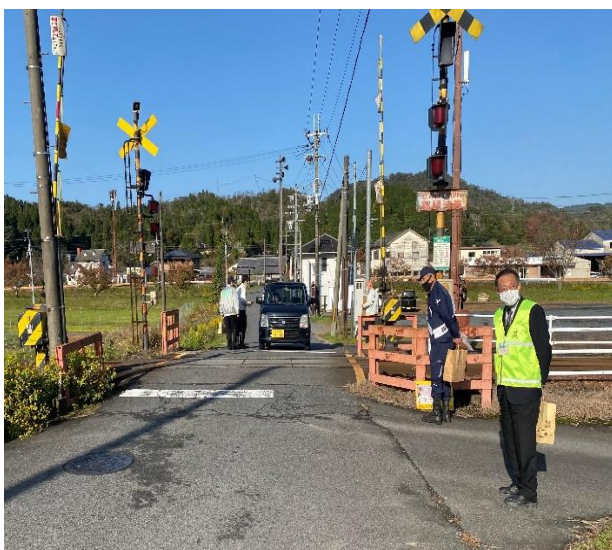
踏切事故防止キャンペーン

より安全で信頼される信楽高原鐵道をつくるため、春・秋の全国交通安全運動、踏切事故防止キャンペーンを通じ安全な鐵道作りへのご参加をお願いするとともに、皆様から安全へのご意見もお寄せ下さい。また、不審者から地域の子供の安全を守り、子供達が安心して暮らせる取り組みとして日本民営鐵道協会と連携し「こども110番の駅」を実施しています。「こども110番の駅」では目印となるステッカーを見て、子供が駅に助けを求めてきた場合に、子供を保護し、子供に代わって110番通報を行うなどの対応をとります。合わせて、踏切・橋梁等の異常を発見されたときは、現地に表記しております「信楽高原鐵道への連絡先」へ御連絡頂きますようお願いいたします。