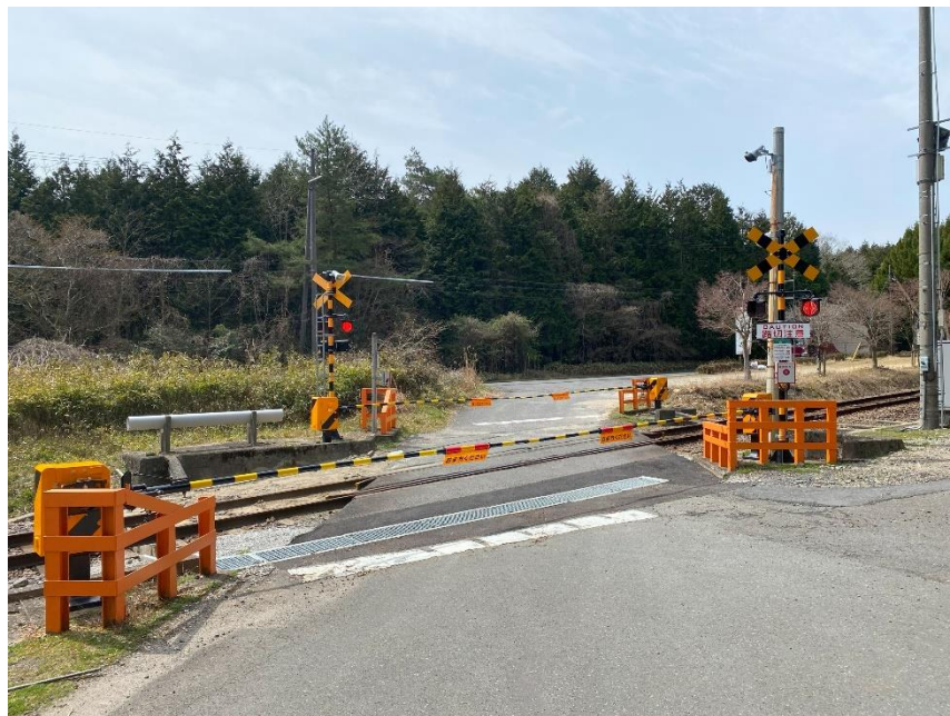
古野踏切の保安度向上と列車接近時の視認性向上

また、踏切周辺設備の保安度向上を図るとともに、踏切通行時の視認性を向上することにより、安全確保に努めているところです。