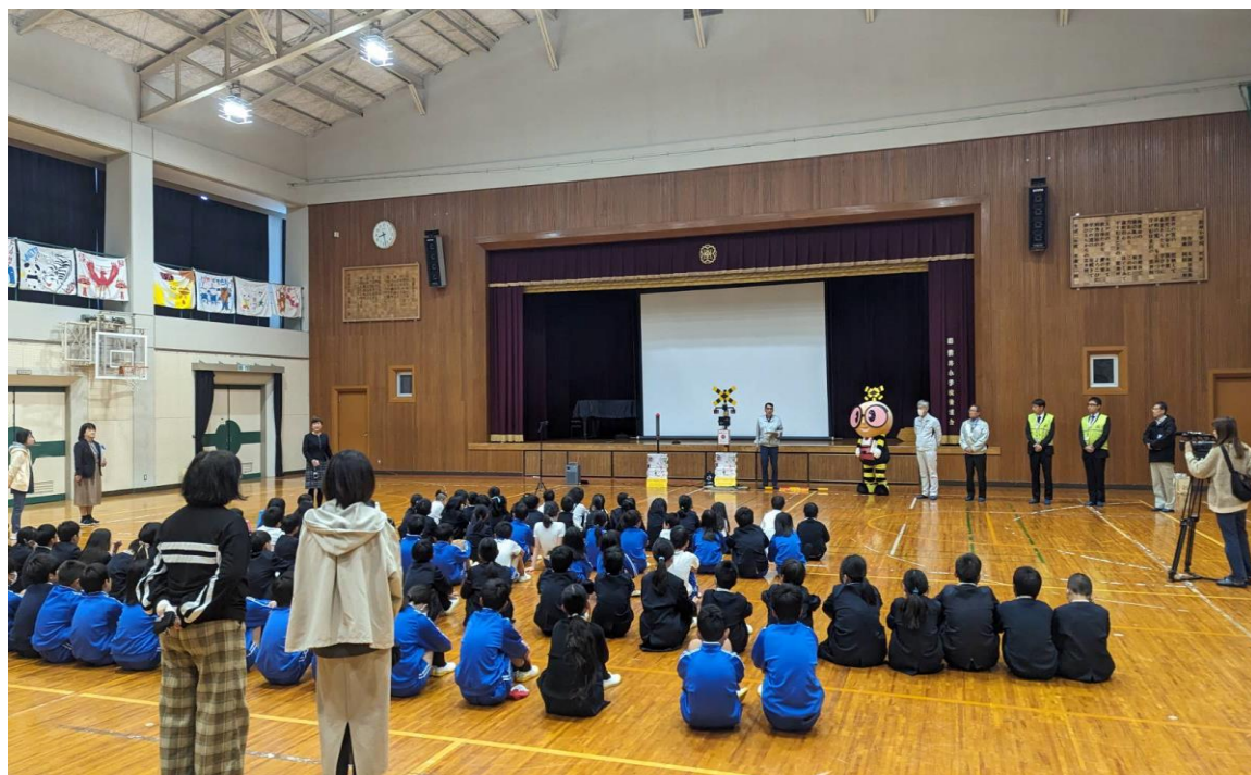
雲井小学校での踏切事故防止キャンペーン

より安全で信頼される信楽高原鐵道をつくるため、春・秋の全国交通安全運動、踏切事故防止キャンペーンを通じ安全な鐵道作りへのご参加をお願いするとともに、皆様から安全へのご意見もお寄せ下さい。令和5年は、地域の雲井小学校にて踏切事故防止キャンペーンの啓発活動として、踏切のデモ機で押しボタンを躊躇なく押下することを体験していただきました。また、地域の老人クラブの皆さんには啓発活動や踏切の安全を通じて啓蒙活動を行いました。また、不審者から地域の子供の安全を守り、子供達が安心して暮らせる取り組みとして日本民営鐵道協会と連携し「こども110番の駅」を実施しています。「こども110番の駅」では目印となるステッカーを見て、子供が駅に助けを求めてきた場合に、子供を保護し、子供に代わって110番通報を行うなどの対応をとります。合わせて、踏切・橋梁等の異常を発見されたときは、現地に表記しております「信楽高原鐵道への連絡先」へ御連絡頂きますようお願いいたします。